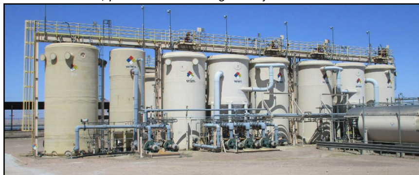
Sistema de Tratamiento de Aguas Subterráneas del Sitio NERT

NERT está investigando la contaminación dentro de un área establecida llamada el Área de Estudio de la Investigación de Remediación de NERT (Área de Estudio). El Área de Estudio incluye el Sitio NERT y áreas aledañas al norte, este, y noreste del Sitio NERT. El Área de Estudio está dividida en tres áreas categorizadas como “Unidades Operativas” u “OUs” (por sus siglas en inglés), las cuales son mostradas en el mapa incluido en este paquete. Cada una de estas tres OUs tiene sus propios objetivos de limpieza, teniendo como meta final mitigar o minimizar el movimiento de aguas subterráneas contaminadas desde el Área de Estudio hasta el Canal Las Vegas para proteger el Lago Mead, el Río Colorado, y todos los intereses aguas abajo.